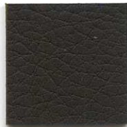
33599 black E

Speziell für die Ausstattung von Autos der gehobenen Mittel- und Luxusklasse (Audi, BMW, Mercedes, Porsche etc.) sowohl für die Erstausrüstung als auch für die Nachrüstung.